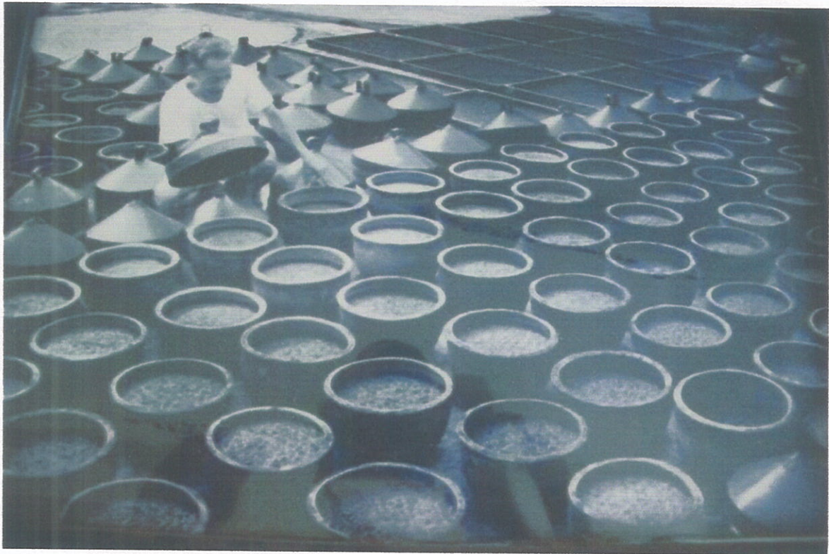
Dokumentasi suasana pengolahan tauco di pabrik tauco Cap Meong