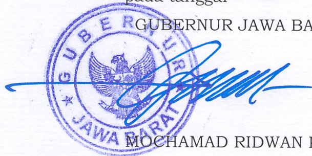
MOCHAMAD RIDWAN KAMIL